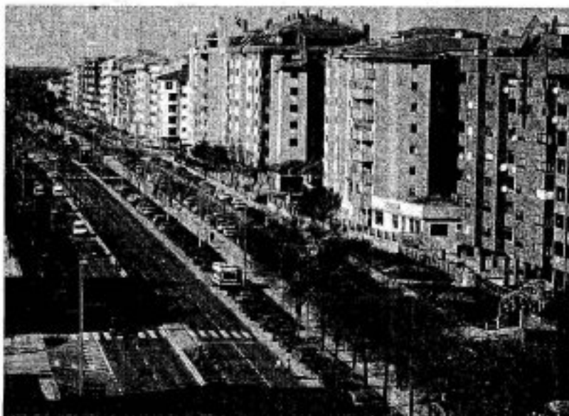
Avenida Ruta de la Plata, uno de los ejes de la nueva asociación vecinal.

De ese encuentro salió el compromiso del Ayuntamiento de hacer lo posible para encontrar una solución a esta demanda del colectivo, que tiene como sede oficial un despacho en las instalaciones de La Madrina Peña del Cura (en la calle Abilio Rodríguez Restillo). Entre las posibilidades está que Vía de la Plata pueda